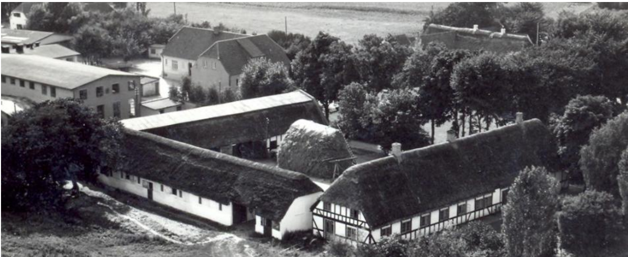
Ellegård, ca. 1940, Hårby