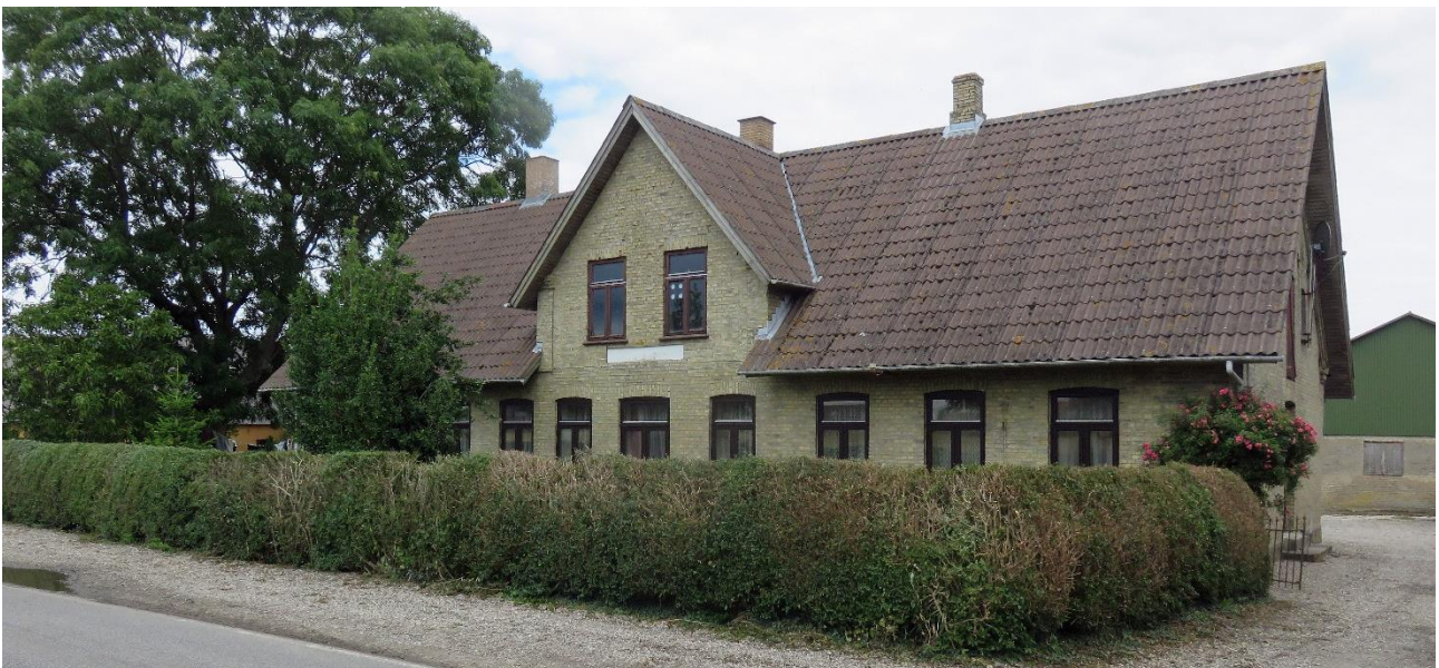
Dyvigvej 10, Holm (2020) – huset her er opført i 1912