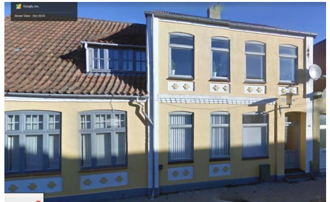
Holmgade 14, Nordborg (2018)