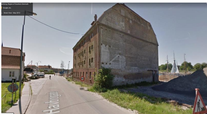
2018 Havbogade 120

VI.54.3 Hans Kallsen · lodsoldermand ∞ VI.54.3a Ida Margrethe Bronck * 3/6-1805 Sønderborg [34] 7/1-1834 * 25/2-1809 Sønderborg [77] † 20/11-1872 Sønderborg [280] Sønderborg † 27/7-1867 Sønderborg [185]