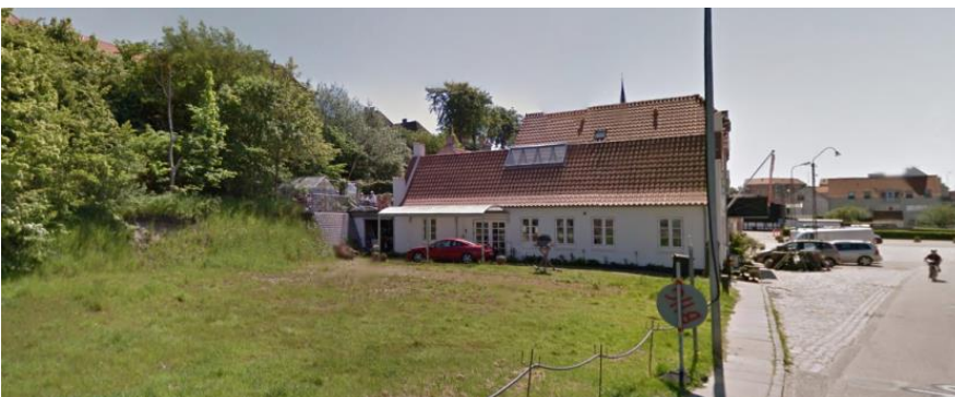
2018 · Havbogade 89