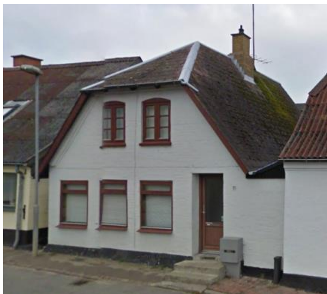
2018 Skomagergade 11, Nordborg